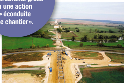
Offre de concession Ligne à Grande Vitesse Sud Europe Atlantique.

30 M€ d'économies potentielles de carburants grâce à une action « éconduite de chantier ».