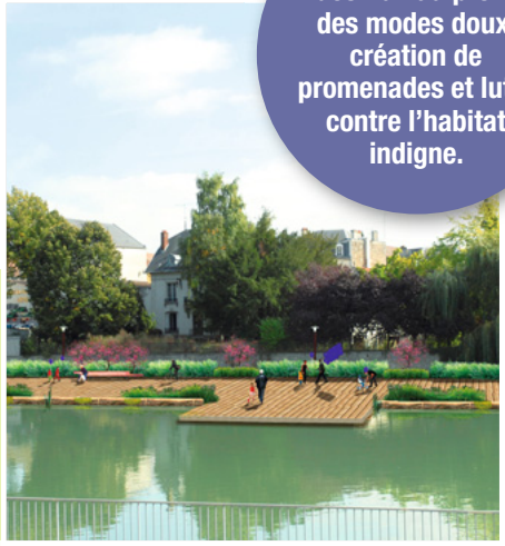
Cœur de Ville à Meaux (77).

Plus de polyvalence pour les espaces publics avec un renforcement de la convivialité et des centres d'intérêts du quartier, grâce à un atelier participatif sur un programme de gare et d'éco-quartier à Rouen (76).