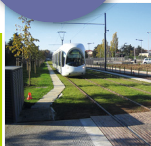
Tracé de LEA à Lyon (69).

100% de réutilisation de déchets verts sur l'éco-quartier de Bruz (35).